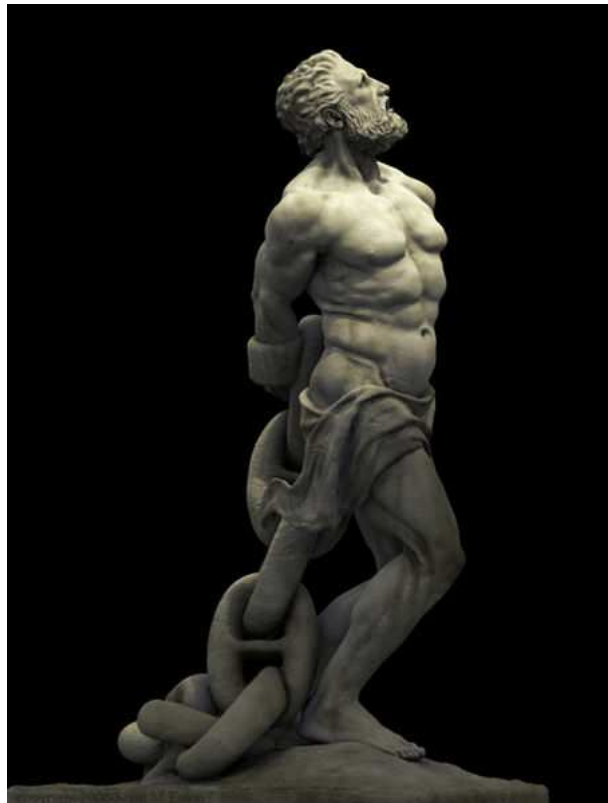
Prometheus Bound , by Scott Eaton, (2006).